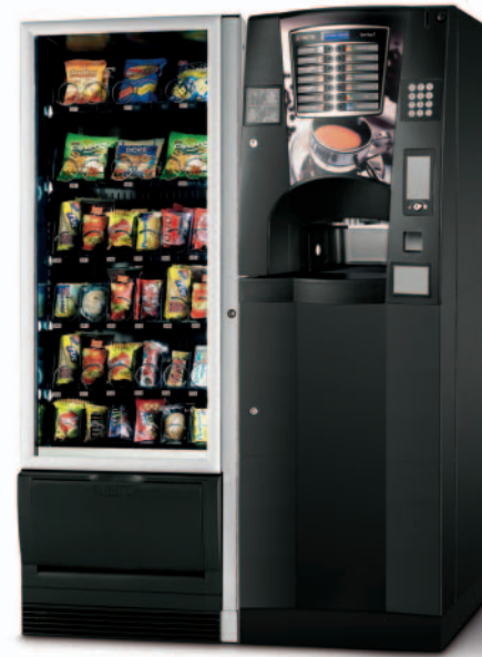
Kombinationsmöglichkeiten mit Snakky und Snakky SL