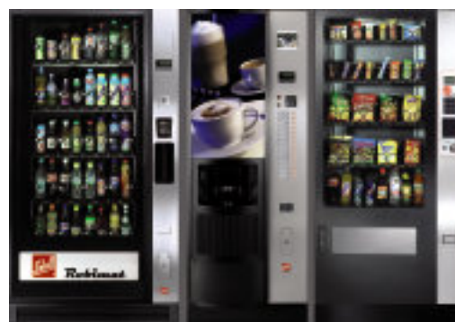
Station aus Robimat 99 EC, CVS 500 EC und SN48-5 Ebenen mit EC-Blende