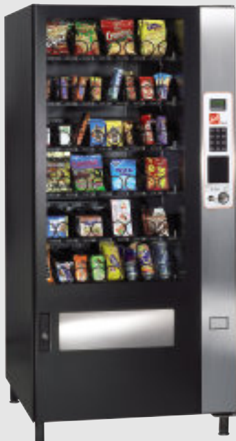
SNACK 48 EC lackiert in RAL 9005 (tiefschwarz)