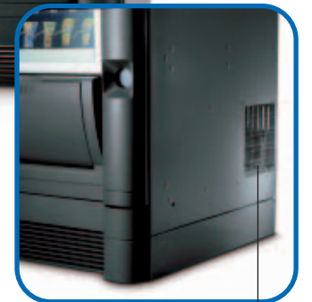
Seitenausgang für warme Luft.