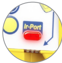
Infrarot-Abrechnungssystem nach EVA/DTS-Standard