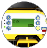
Benutzerfreundliches Display mit intuitivem Menüsystem inkl. LED-Diagnostik