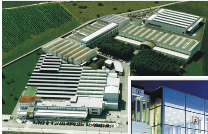
Azkoyen in Peralta (Navarra), Spanien