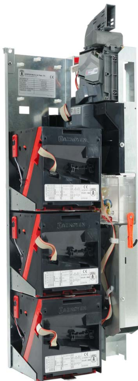
Azkoyen Combo-Tower für eine komplette Münzverwaltung mit Münzprüfer, Sortierung der Münzen mit Zwischenspeicherung und Geldrückgabe