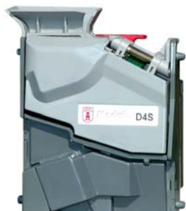
Münzprüfer Modular X D4S mit Standardaufhängung und Einwurf von oben