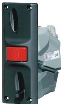
Münzprüfer Modular X D4S mit Frontplatte